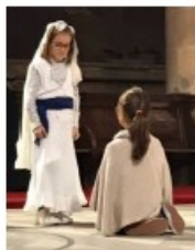
Sainte Bernadette Soubirous prie le chapelet devant la grotte de Massabielle.