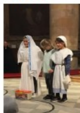
Sainte Teresa à Calcutta prend soin des lépreux.