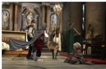
Saint Martin de Tours, entouré de ses soldats, est prêt à partager son manteau avec un mendiant.