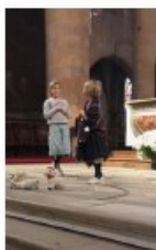
Sainte Germaine de Pibrac garde ses moutons en priant le Seigneur.